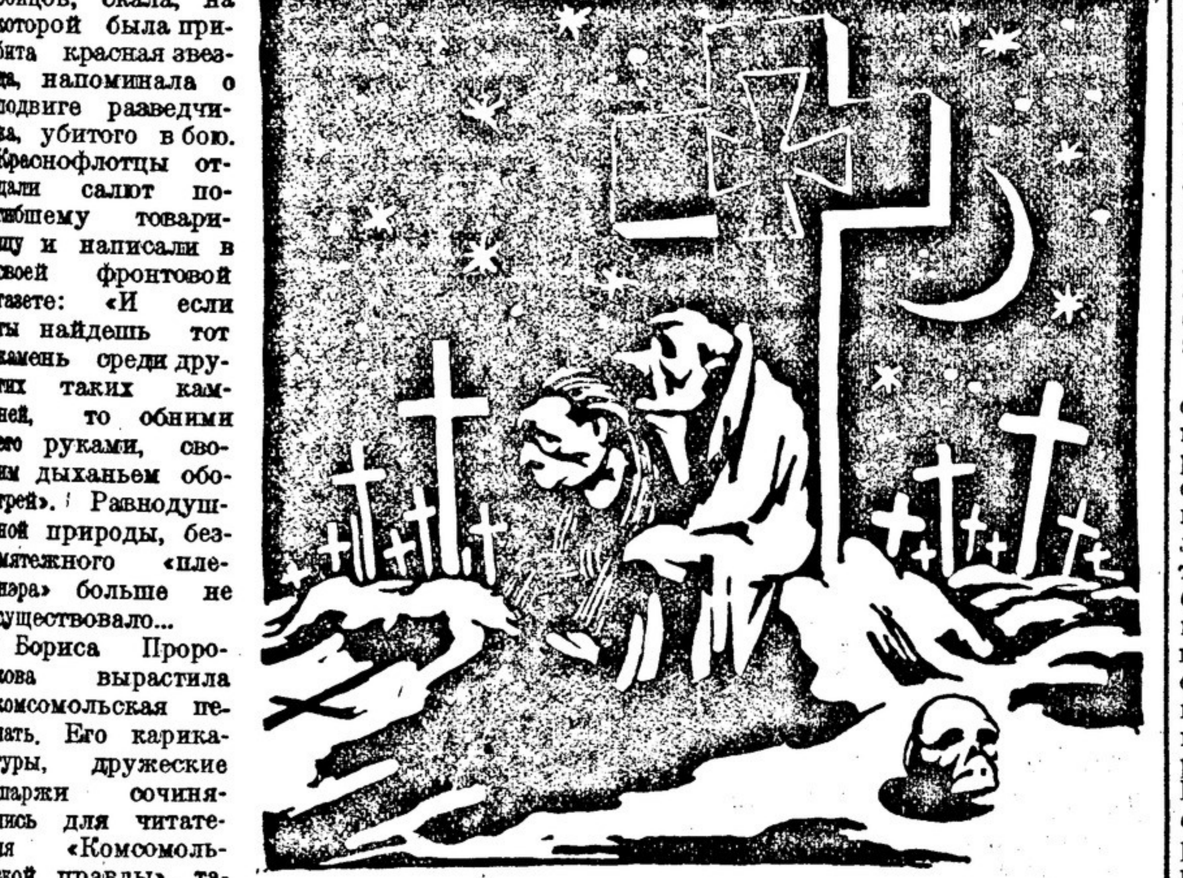
«Гробовое молчание» Рисунок художника Б. ПРОРОКОВА.

Борис Пророков ушел на фронт добровольцем. Почти десять месяцев войны он провел на переднем крае обороны среди бойцов и бесконечно нес свою вахту во фронтовой газете. Пророков — художник, но в тех условиях он прежде всего был бойцом. Героически защищая краснофлотский артиллерийский дивизион. Крутым все делало войной. Даже величественные и суровые пейзажи, которые всегда приносили художнику отраду, серые морты боевого затишья, нельзя было воспринимать вне войны. В лесах и скалах таились вражеские снайперы, земля была изрыта десятками тысяч снарядов, гранат и мин. Морозы кроваво били, земля была красна, как ладонь, и на нее падала ошметки разведчиков, убитого в бою. Краснофлотцы отдают салют товарищу и написали в своей фронтовой газете: «И если бы найдешь тот камень среди других таких камней, то обними его руками, своим дыханьем обогрей!» Равнодушный природы, безмолвного «шлепа» больше не чувствовалось... Борис Пророков выросла комсомольская пещера. Его карикатуры, дружеские шутки очинялись для читателей «Комсомольской правды», так же его молодого и жаждало искусство.