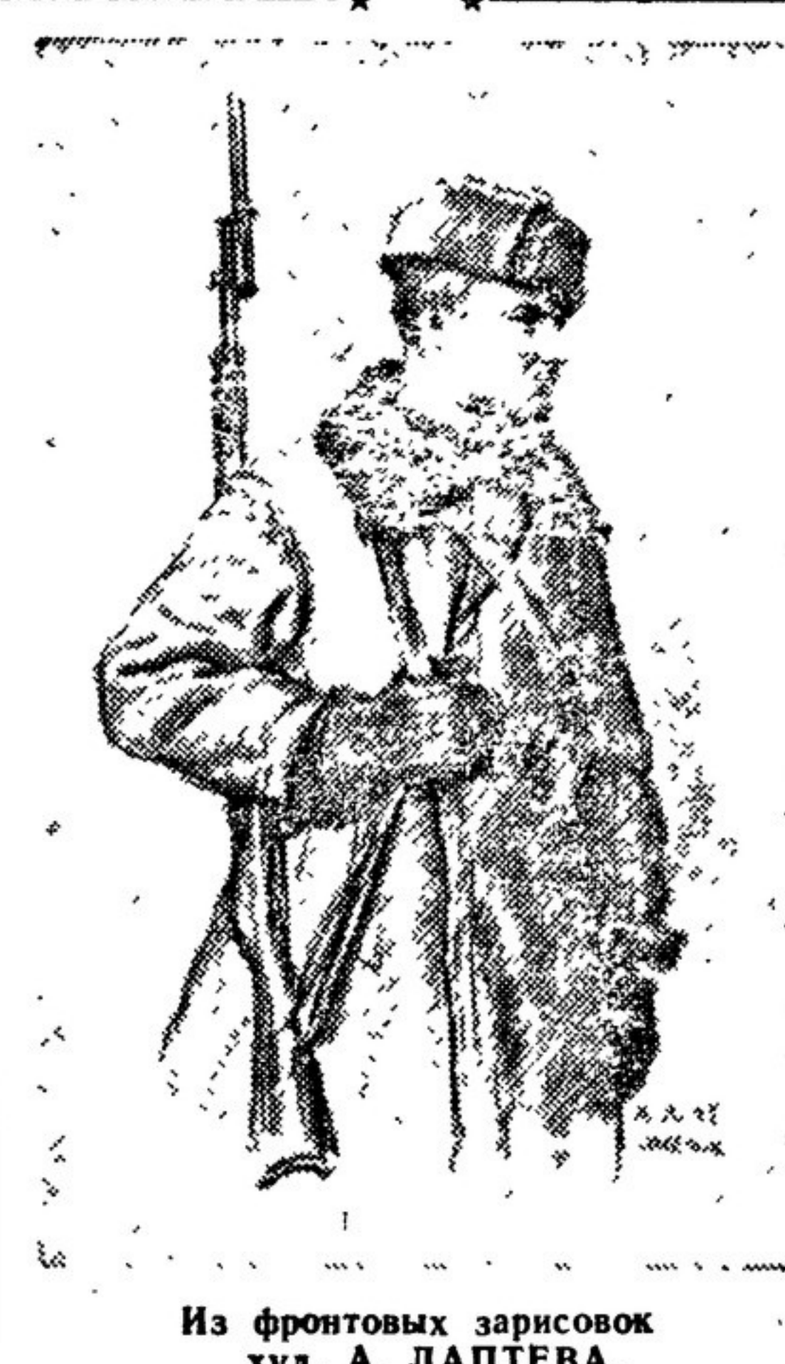
Из фронтовых зарисовок худ. А. ЛАПТЕВА.